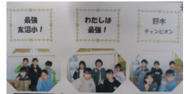
出場を予定していた3チームと練習の様子

今年は、名乗りを上げた児童の中から男子2チーム、女子1チームが結成されました。12月~1月まで、休み時間や放課後の限られた時間で、タイムトライアルやたすきの受け渡しの練習などを直前まで練習し、家庭でも自主練習を続けてきました。限界突破を目指して頑張ってきた選手たちに拍手を送ります。